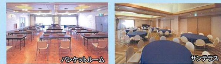
バンケットルーム